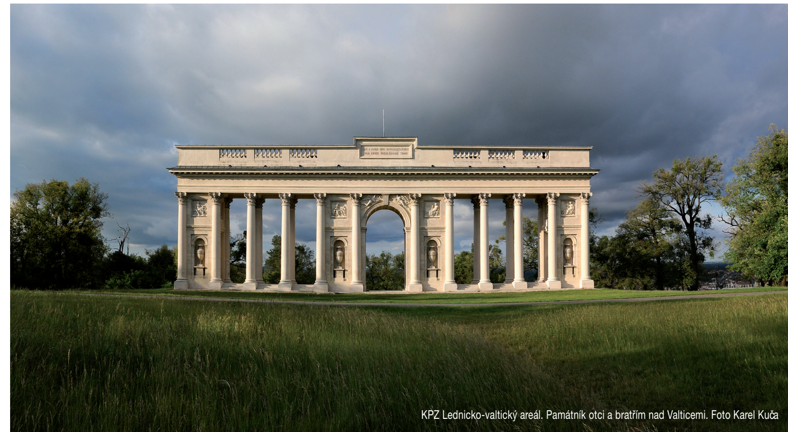
KPZ Lednicko-valtický areál. Památník otci a bratřím nad Valticemi.