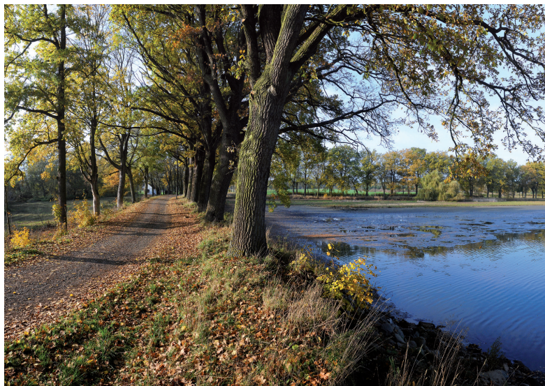
KPZ Čimelicko-Rakovicko. Rybník Nerestec.

Počet takových kulturních památek s výrazně krajinným a zejména přírodním základem je však velmi malý a nelze mluvit o systematickém pokrytí těchto jevů památkovou péčí.