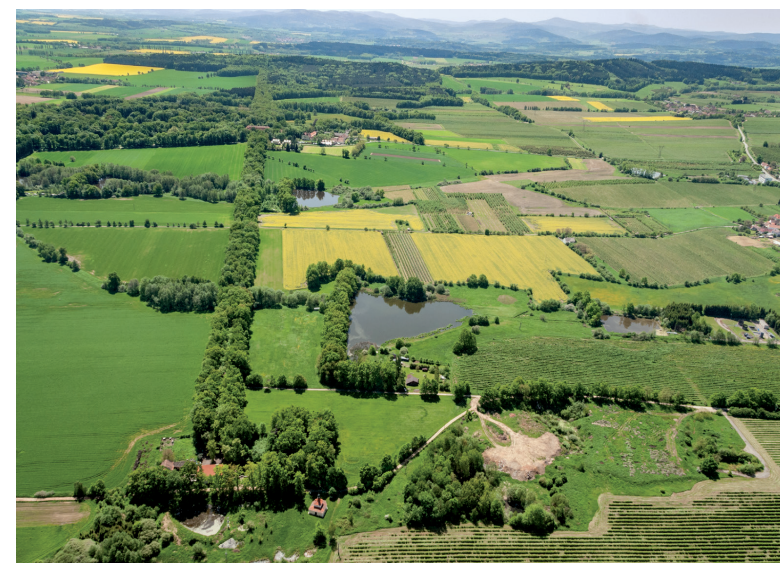
KPZ Libějovicko-Lomecko. Letecký pohled na Lomeckou alej od severu, zcela v popředí Lázeň a kaple sv. Maří Magdalény.

V roce 2015 se podařilo vydat knihu, která kulturní i přírodní hodnoty tehdejších KPZ podrobně mapuje (viz recenze), a zpracována k nim byla metodika, jež má pomoci transparentnímu a diferencovanému uplatňování