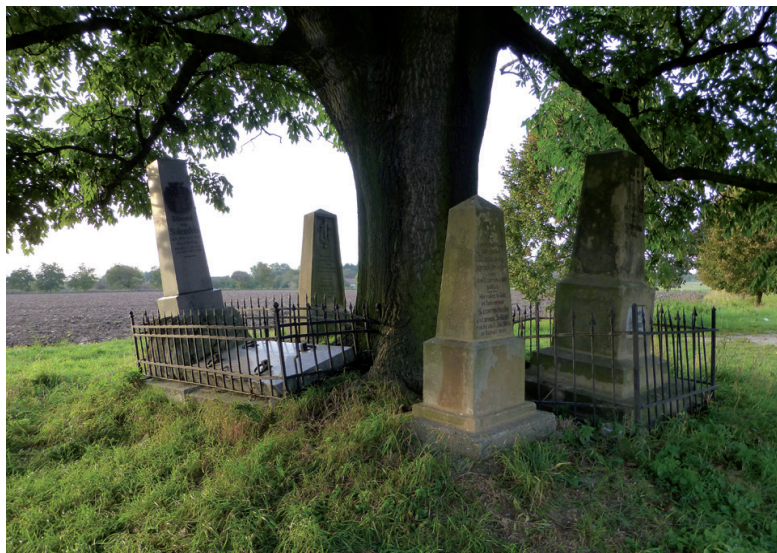
KPZ Bojiště u Hradce Králové. Dlouhé Dvory. Pomník jihovýchodně od vsi. Foto Karel Kuča

Již od sedmdesátých let 20. století byla pocítována potřeba vzniku kategorie plošné památkové ochrany, která by pokryla cenná území s kulturními hodnotami o nižší koncentraci než v památkových rezervacích. Rozšířená koncepce ochrany historických měst se připravovala od počátku 70. let a schválena byla roku 1984. Početila vedle 40 městských památkových rezervací (MPR) se 160 městskými památkovými zónami (MPZ). Souběžně s tím se zpracovávaly také návrhy na vesnické památkové zóny a rezervace (VPR a VPZ), a dokonce i na krajinné památkové zóny (dále jen KPZ). Legislativní oporu získaly památkové zóny až přijetím památkového zákona č. 20/1987 Sb., o státní památkové péči, účinného od 1. 1. 1988. V definici památkové zóny v odst. 1 § 6 se hovoří také o krajině – poprvé v oboru památkové péče – takto: „Území sídelního útvaru nebo jeho části s menším podílem kulturních památek, historické prostředí nebo část krajinného celku, které vykazují významné kulturní hodnoty, může Ministerstvo kultury po projednání krajským úřadem prohlásit za památkovou zónu a určit podmínky její ochrany.“ Rozšíření možností ochrany dalších kulturně-historických území bylo výsledkem velkého nasazení odborníků tehdejšího SÚPPOP, konkrétně Olgy Bašeové a Aleše Vošahlíka. Hned v roce 1990 byly prohlášeny MPZ ve většině tehdejších krajů, v kraji Jihočes-