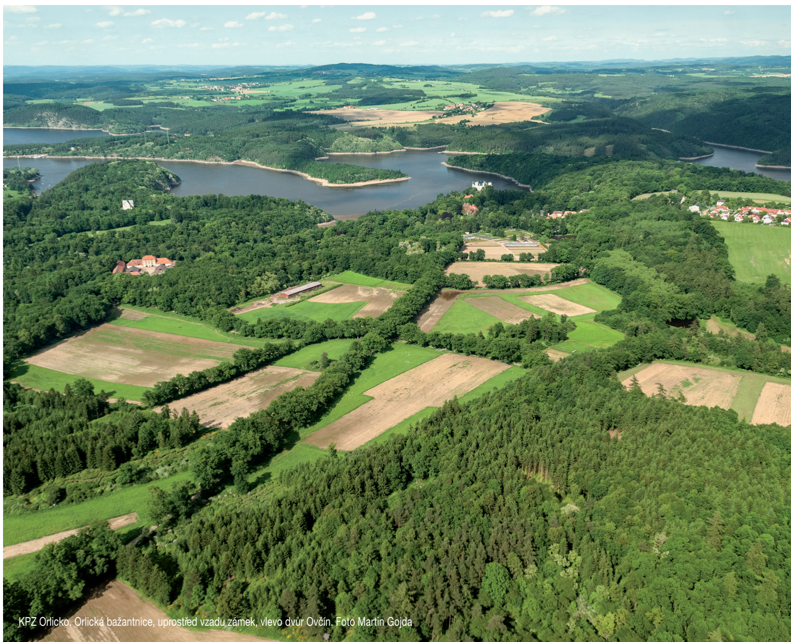
KPZ Orlicko. Orlická bažantnice, uprostřed vzadu zámek, vlevo dvůr Ovčín.

v oddělených resortech, není širší povědomí o těchto chráněných územích samozřejmostí ani u odborných pracovníků, i když oba obory sledují stejný cíl: zachránit dochované hodnoty pro příští generace.