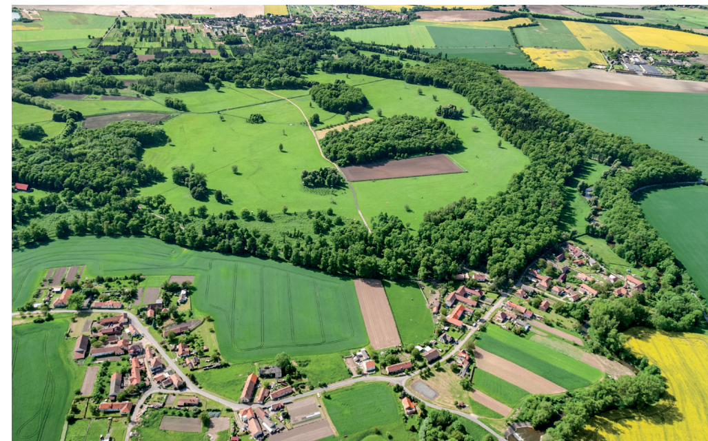
KPZ Žehušicko. Žehušická obora od jihovýchodu, v popředí Bojmany, vzadu Žehušice.

Celkem v 15 případech existujících KPZ není překryv s kategoriemi ochrany přírody, pouze KPZ Bečovsko leží celá na území CHKO Slavkovský les. V sedmi KPZ je překryv podstatný a je namístě tyto případy také vyjmenovat: Celý přírodní park Niva Dyje leží k KPZ Lednicko-valtický areál a představuje asi čtvrtinu jeho území. Celý přírodní park Zlatý kopec leží v KPZ Hornická kulturní krajina Abertamy-Horní Blatná-Boží Dar a tvoří asi třetinu její plochy. Téměř celá KPZ Slatiňansko-Slavicko leží na území CHKO Železné hory. Třetina území KPZ Novohradsko se překrývá s přírod-