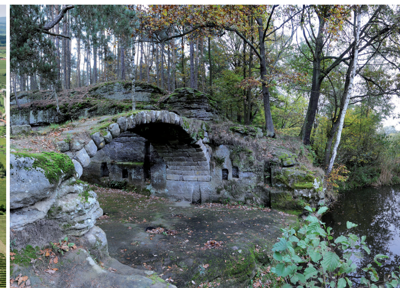
KPZ Zahrádecko. Klenutý můstek přes vyústění průrvy Hrázského rybníka.

V letech 2016–2020 navazuje projekt Identifikace a prezentace památkového potenciálu historické kulturní krajiny České republiky, jehož cílem je např. typologie kulturních krajin a také identifikace území vhodných k ochraně formou KPZ. Pozornost přitom bude věnována