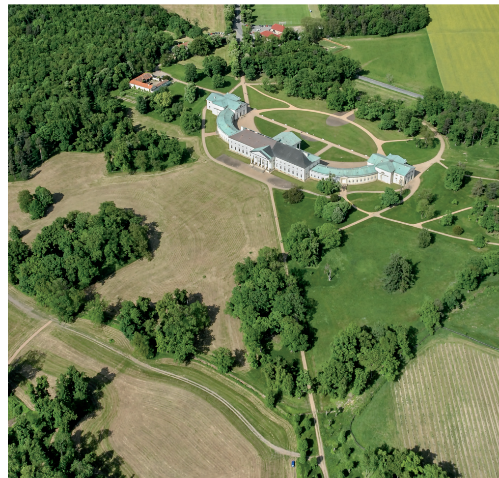
KPZ Žehušicko. Zámek Kačina od jihozápadu.